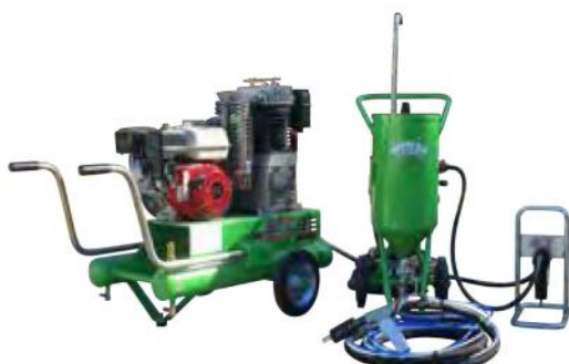
KIT TOPOLINO 18