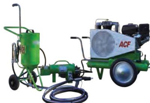
MAXI TOPOLINO 18